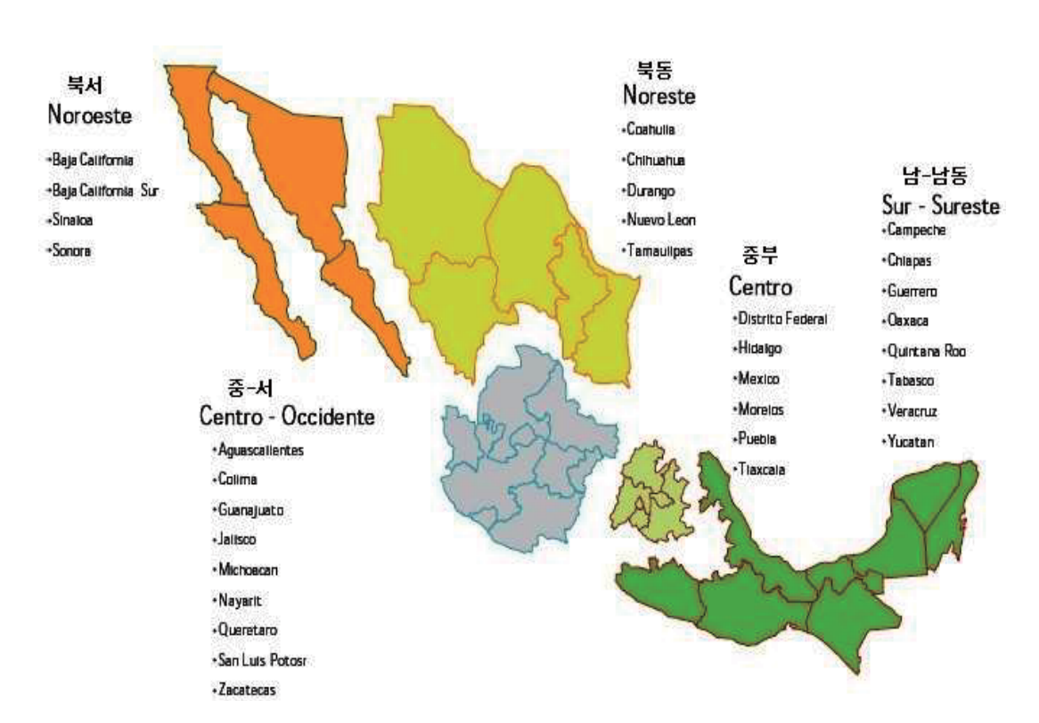
<그림 2> 멕시코 천연가스시장의 지역별 분포71)

체로 인한 경제활동 저하에 타격을 입은 민간전력부문과 산업부문을 중심으로 소비 감소가 나타났다.<sup>70)</sup>